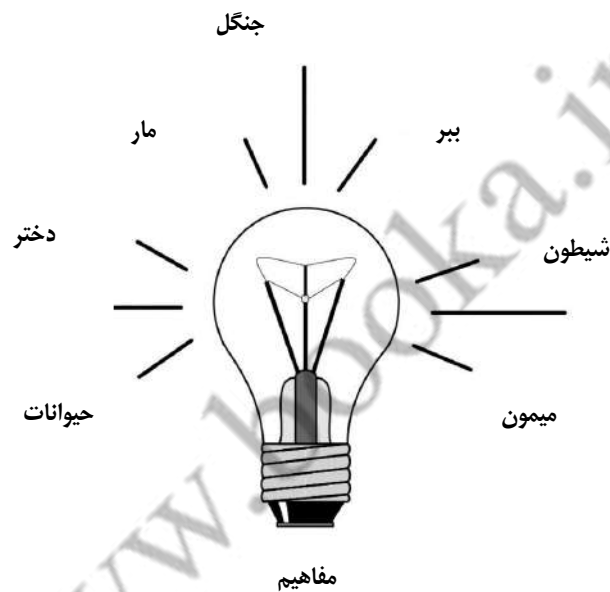
شکل ۴: جنبه‌های خلاقانه نوشتن: خلق مفاهیم

کودکان پیش از نوشتن باید مفاهیم ذهنی خود را درباره آنچه که می‌خواهند بنویسند، سازماندهی کنند.